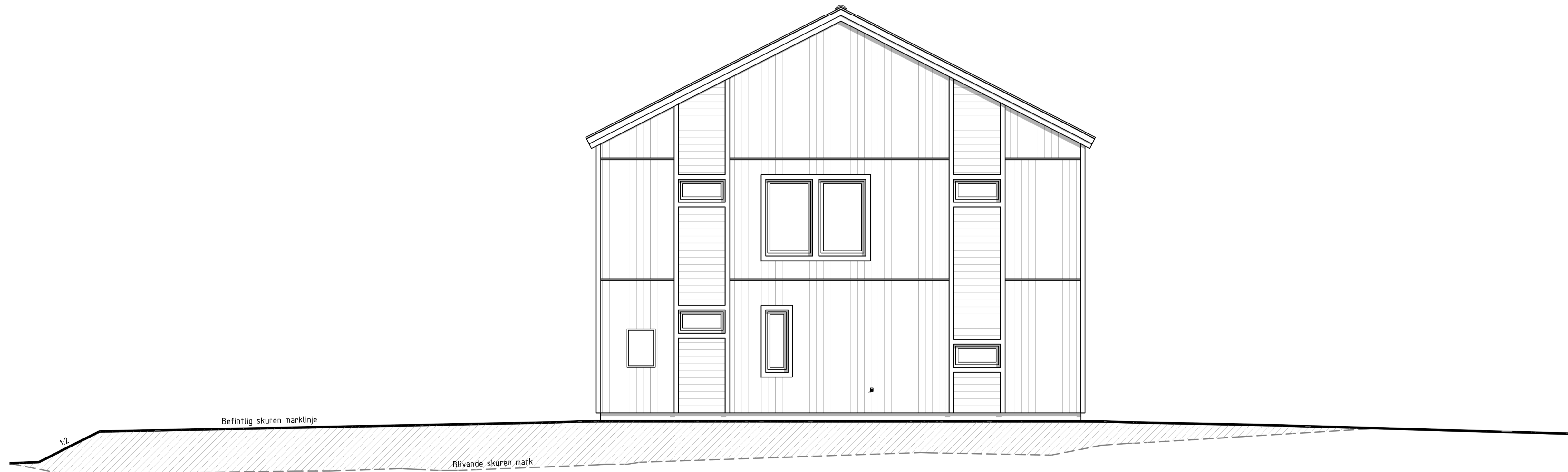
FASAD B 1 : 50 Fasadelevation mot väst