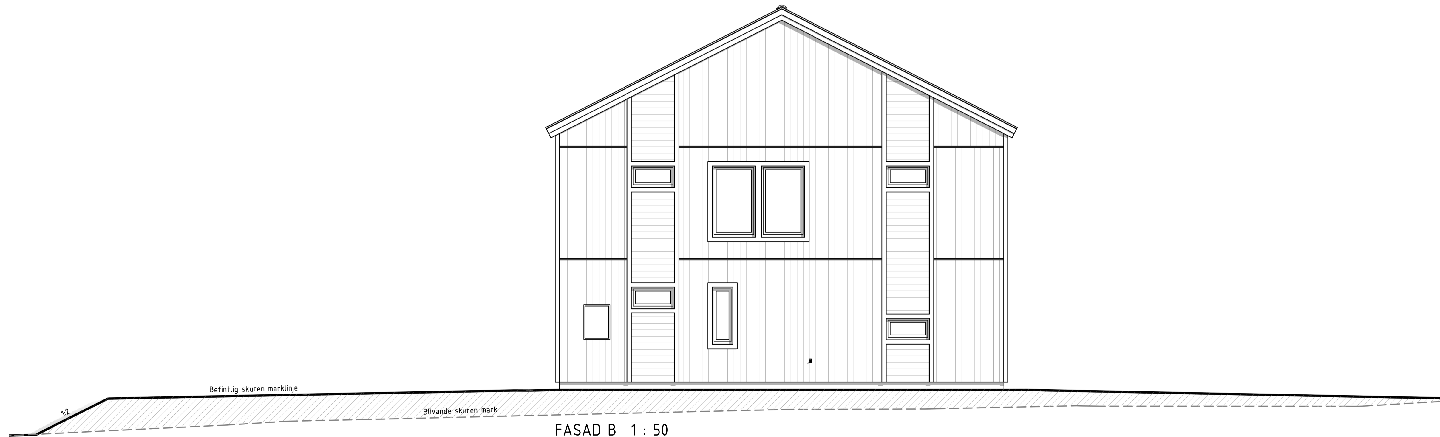
FASAD B 1 : 50 Fasadelevation mot väst