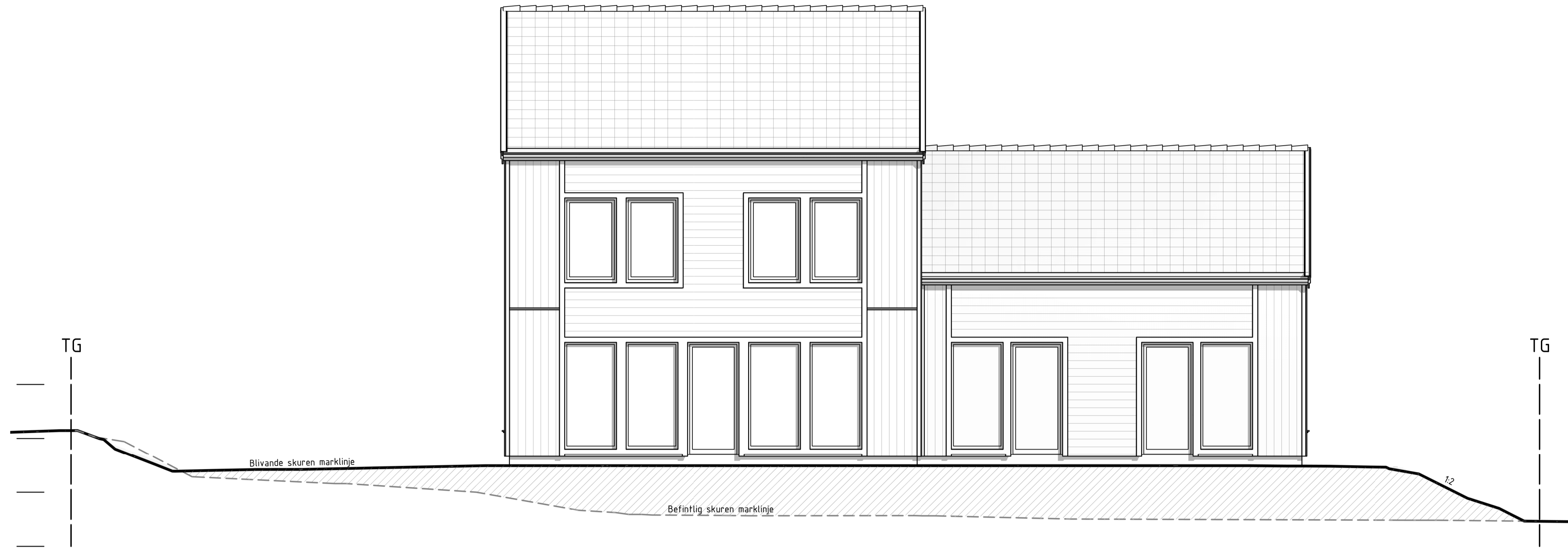
FASAD C 1 : 50 Fasadelevation mot söder