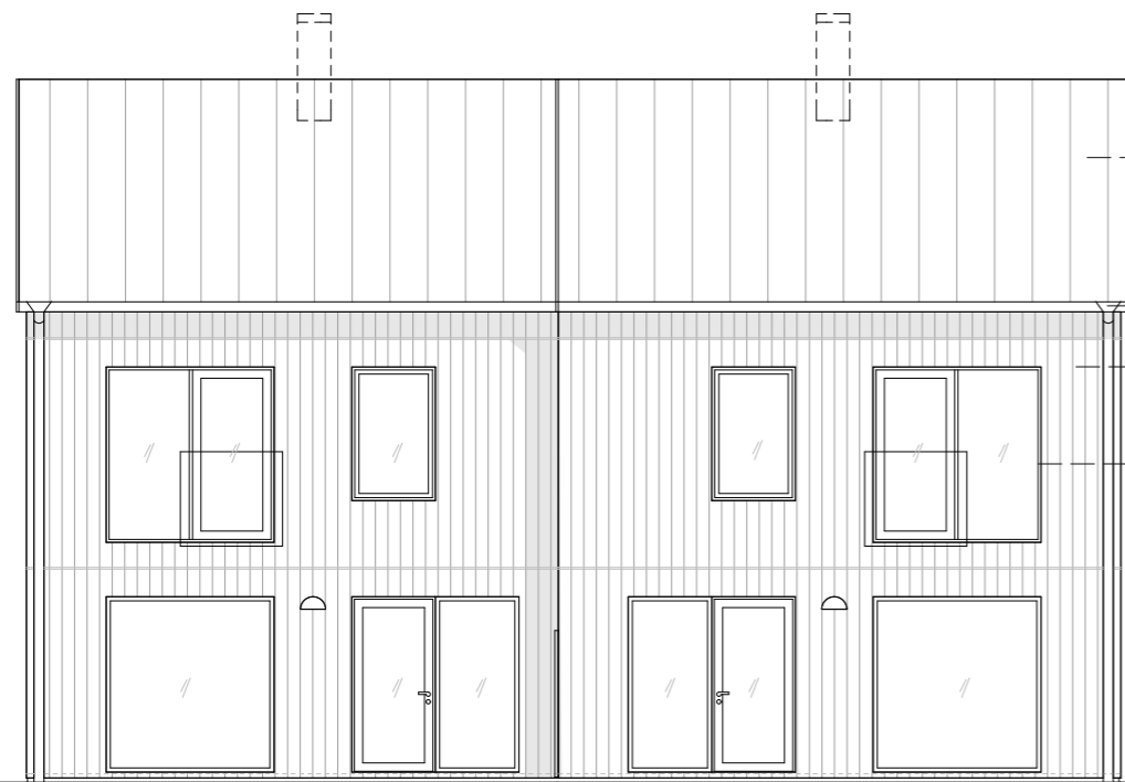
FASAD MOT VÄST

TAK UTFÖRS MED GRÅ TAKPAPP LAGD I BANDPLÄTSLIKNANDE VÄDER MED TREKANTSSTAV CC 400 UNDER PAPP